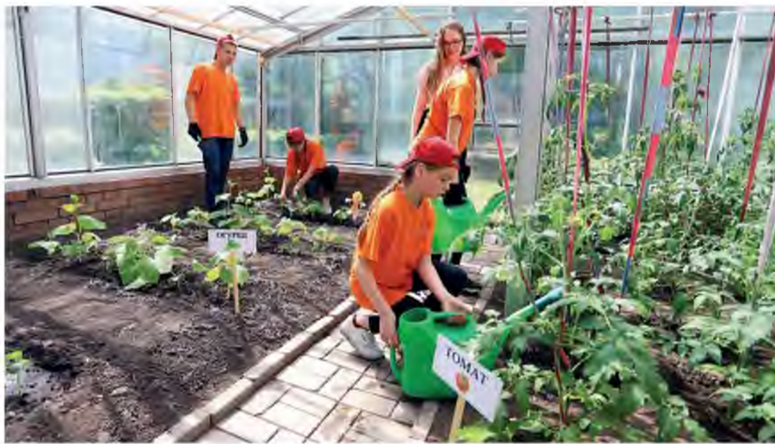
Тольяттиазот поддерживает воспитанников социального приюта «Дельфин» и помогает развивать их проекты

Цех оперативного сопровождения ремонтов и обслуживания агрегатов – самый многочисленный на заводе. В нём трудятся 310 тоазовцев. Чтобы в сжатые сроки добиться высоких показателей вакцинации, коллеги проявили ответственность и внима-