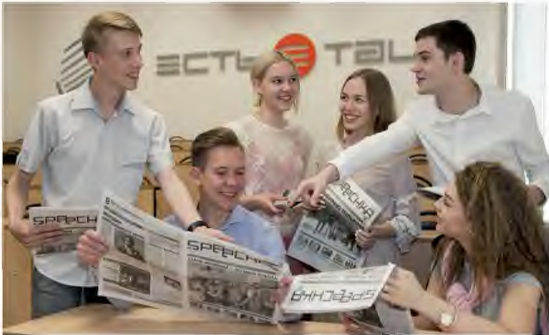
Студенты журфака ТГУ – авторы проектов в молодежном медиахолдинге «Есть talk!»

– Кто выбирает темы: авторы или руководители вуза?